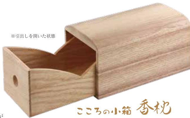
※引出しを開いた状態

平安時代、髪に移香させるために使われた 優雅な装い道具「香枕」 思いを込めた手紙とお香を入れて故人に捧げる 「心の小箱」としてお使いください